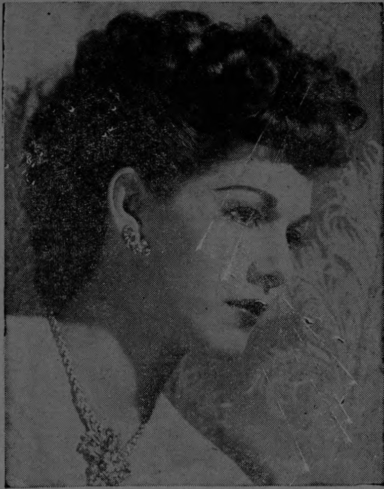
Max Factor Jr., experto de belleza de Hollywood, hace notar que MARIA MONTEZ, estrellita de Universal-International, tiene un cabello tan bonito que no hay razón para que desee cambiar su color.

Entonces, ¿qué decir de usted, respecto a ser rubia hoy, de cabello negro la semana que viene, castaño a la siguiente, y así sucesivamente?